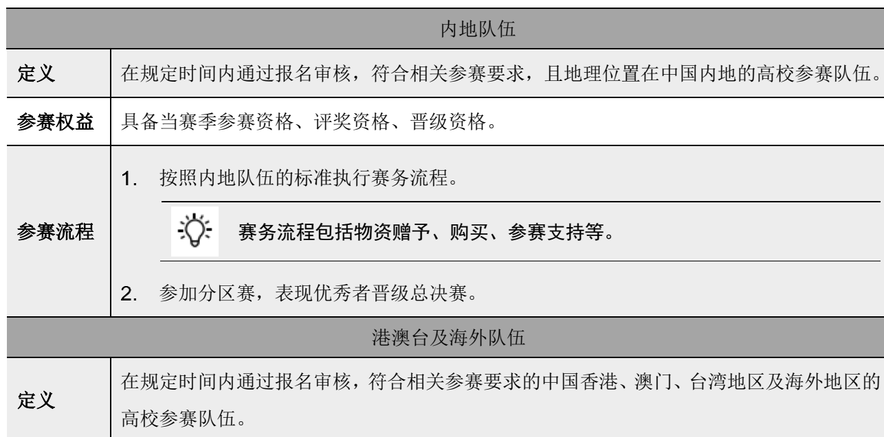
表 3-4 参赛队伍类型